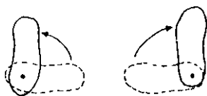
Figura 2: Esquemas de pies de pivote rechazados